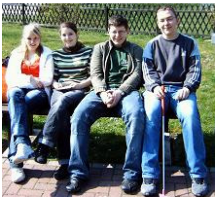
Während sich einige über ihr Golfergebnis offenbar freuen ....