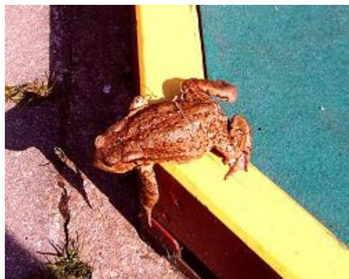
... sucht so mancher Zuschauer entsetzt das Weite ....