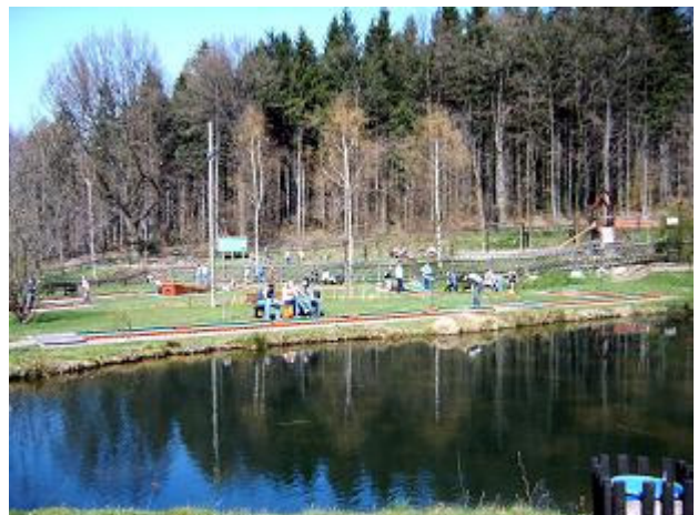
Endlich mal kein Schach!