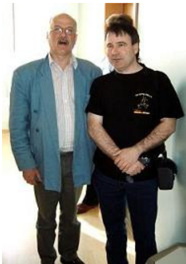
Alte Bekannte und neue Gesichter ....