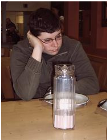
Was habe ich nur wieder gespielt ...

Die Bedingungen in Sebnitz waren wie immer sehr gut. Die folgenden Impressionen geben einen kleinen Einblick in das Geschehen beim Schach, beim traditionellen Minigolf und bei der Siegerehrung.