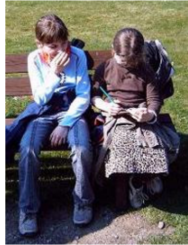
Zweifel am Golfergebnis ???