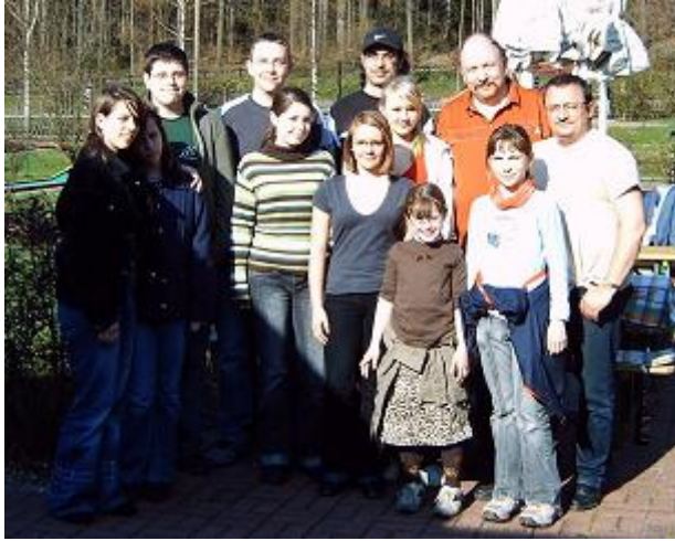
Gruppenfoto nach dem Minigolf (die spätere Sachsenmeisterin hier noch etwas im Schatten)